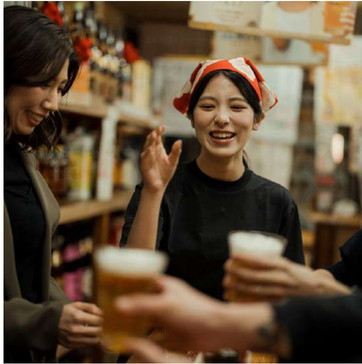
まち/行政ネットワーク (ソフト)