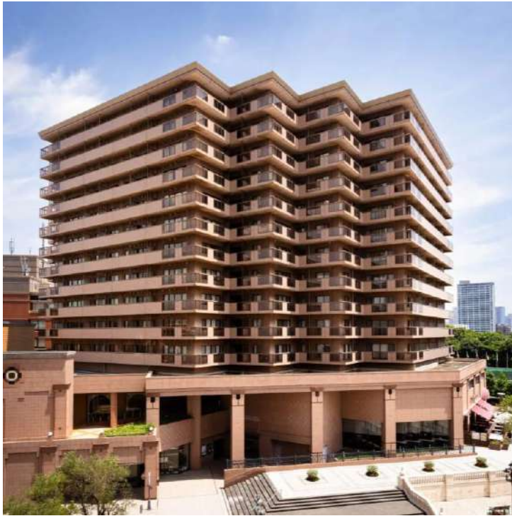
レジデンス・公園・広場 (ハード)