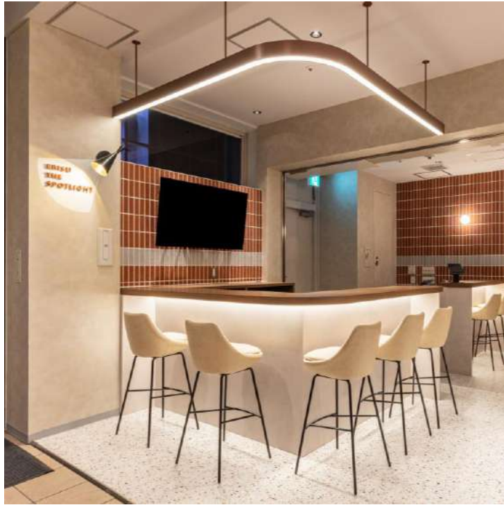
イベント・コミュニティ (ソフト)