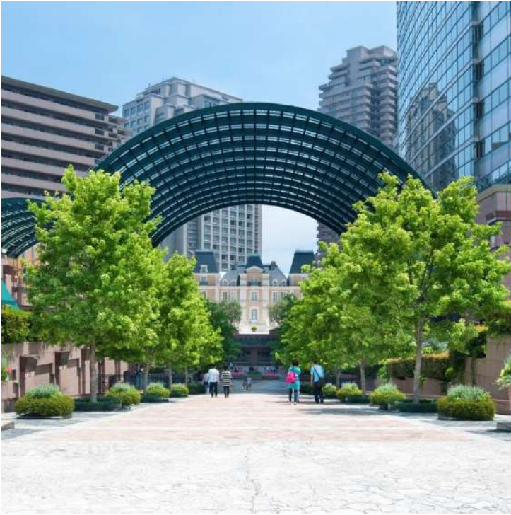
オフィス・商業施設 (ハード)